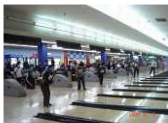
ボウリング (平成21年12月5日)