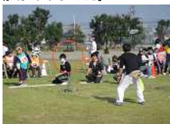
フライングディスク (平成21年10月31日)