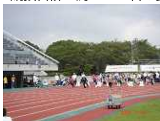
陸上競技 (平成21年9月12日)